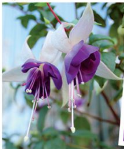
Onze fuchsia, ik geloof dat dit de 'Carmel Blue' is, heeft vorig jaar zo prachtig geteeld dat er geen houden aan was.