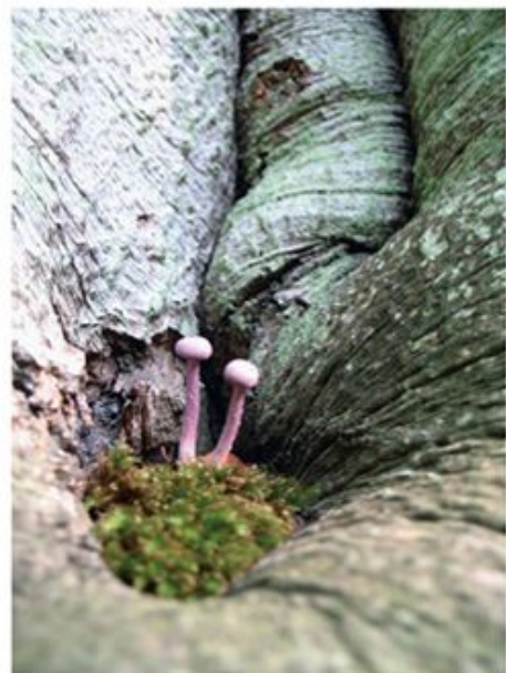
Verstopte paddestoelen in het mos. Anna Hendel, Overveen