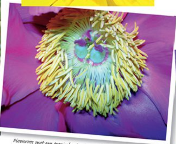
Pieperros met een tropisch uiterlijk doordat de foto in de schemering is gemaakt en ik per ongeluk flitste.